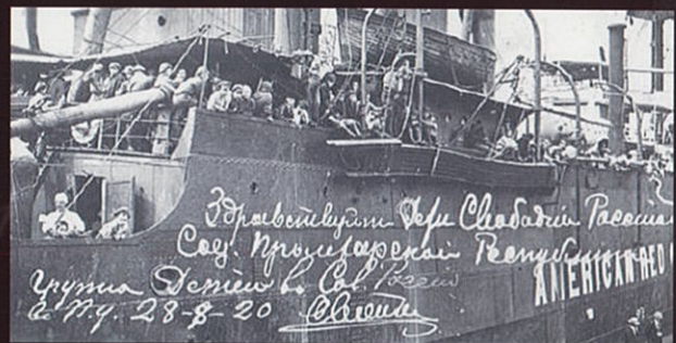
ニューヨークに到着した陽明丸