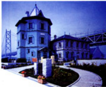
舞子移情閣 (孫中山記念館)

2006年南京町の春節祭は、1月29日～2月5日に決定しました！！楊貴妃や諸葛孔明など中国史の人物の仮装パレードもあります。