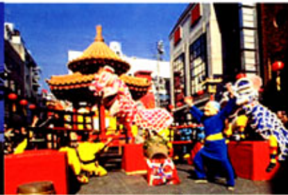
南京町春節祭 (元町)