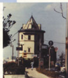
橋ができる前の移情閣('88撮影)