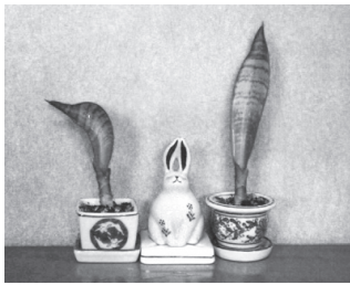
友達から分けてもらったサンスベリア（トラノオ）から増えた子株ちゃん。増え続けてます。

〒650-8570 神戸市中央区加納町6丁目5-1 TEL078-322-5844 FAX078-322-6161