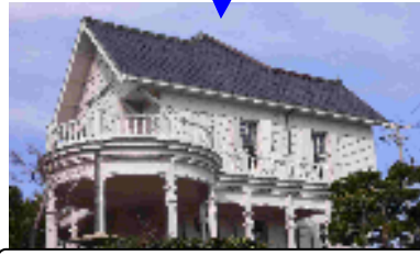
狩口台にある武藤山冶邸

旧武藤山冶邸は、鐘紡社長で鐘紡を発展させた立役者でもあり、衆議院議員も務めた武藤山冶氏が明治40年に自宅として建設した建物。武藤氏の没後、カネボウの保養施設として使われていたが、明石海峡大橋の工事に伴い、狩口台に移設されました。