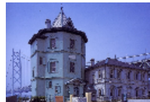
現在の移情閣(孫中山記念館)