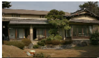
旧木下邸(旧又野邸)

旧木下邸は、昭和16年～18年に建てられた数寄屋造りの近代和風住宅で、国の登録有形文化財。あまり知られていませんが、住宅街の隣の舞子公園の中にひっそりと佇んでいます。震災を免れた貴重な昭和戦前期の建築物であり、母屋をはじめ土蔵・納屋など、屋敷構えがほぼ完全に残される大変珍しい事例です。昨年12月から保存修理工事に着手され、2009年春の工事終了後は、茶道等の文化活動を楽しめる体験学習施設として公開される予定です。