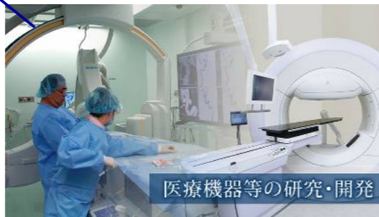
医療機器等の研究・開発