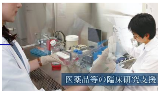
医薬品等の臨床研究支援

「医薬品等の臨床研究支援」 「医療機器等の研究開発」 「再生医療等の臨床応用」 の3つの分野で、基礎研究を実用化につなげていくための研究開発、臨床研究支援、実用化支援を行っています。