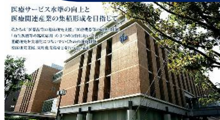
先端医療センター

1980年大阪大学医学部卒業。国立循環器病センター産科医長・企画室長、デューク大学附属病院（臨床試験研究所）などを経て、2000年に先端医療振興財団臨床研究支援部長。2010年より現職。医学博士。