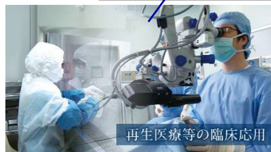
再生医療等の臨床応用